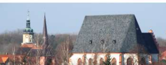
St. Marienkirche, erbaut um 1512 Orgel von Gottfried Silbermann, 1722