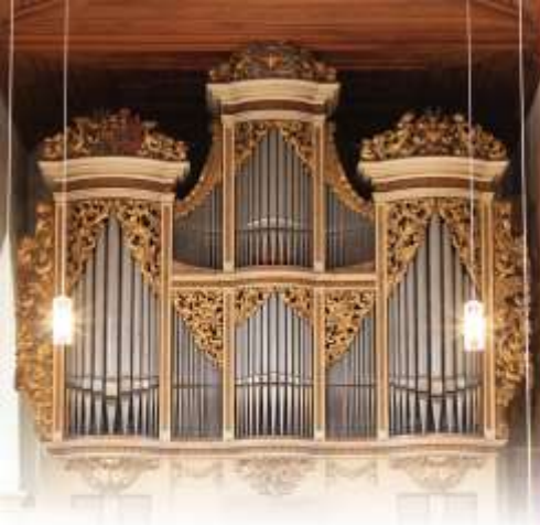
St. Georgenkirche, erbaut um 1150 Orgel von Gottfried Silbermann, 1721